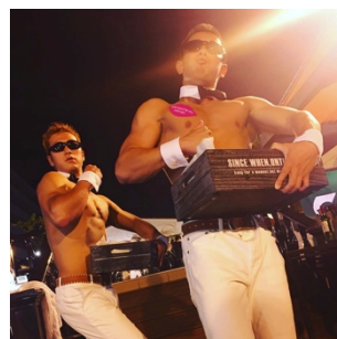
昨年の様子（ポテトガイ）

昨年好評だった、ポテトガイ2名が、毎週火曜・木曜の「女子会デイ」にポテトをデリバリーいたします。