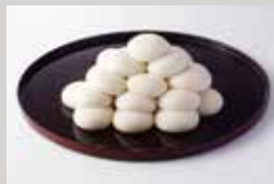
お供え餅 1個¥140 (15個以上)