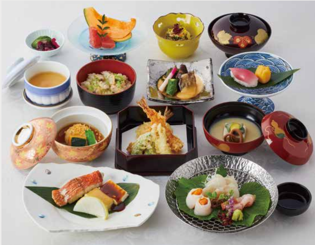
日本料理会席イメージ ¥13,000