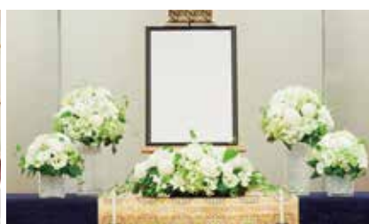
プラン内 祭壇装花