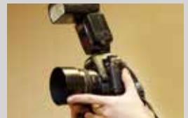
集合写真 ¥45,000 (30名様まで)

※表示料金にはお料理・会場料(2時間)・サービス料・消費税が含まれております。 ※仕入れ状況により食材・メニュー内容が変更になる場合がございます。 ※ドリンクの料金は別途いただいております。※お米は国産米を使用しております。※写真はイメージです。[2024年7月現在]