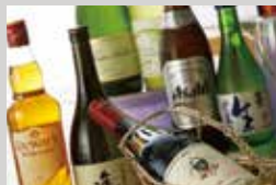
お飲物 ¥600～ 飲み放題 ¥2,200～