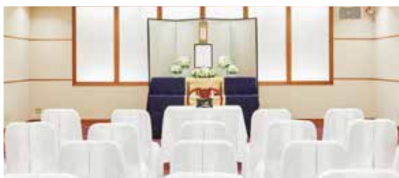
プラン内 祭壇装花