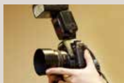
集合写真 ¥45,000 (30名様まで)

いております。 ※メニューに特別な記載がない限り、国産米を使用しております。 ※写真はイメージです。