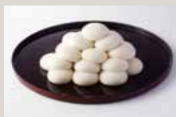
お供え餅 1個¥140 (15個以上)