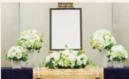
プラン内 祭壇装花