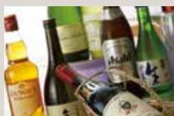
お飲物 ¥560～ 飲み放題 ¥2,000～